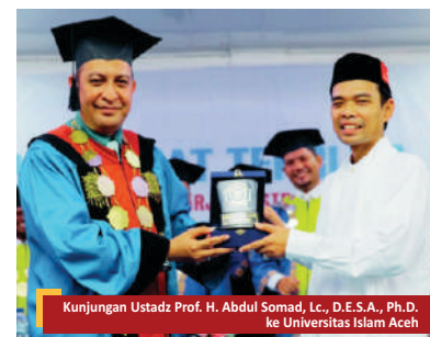
Kunjungan Ustadz Prof. H. Abdul Somad, Lc., D.E.S.A., Ph.D. ke Universitas Islam Aceh