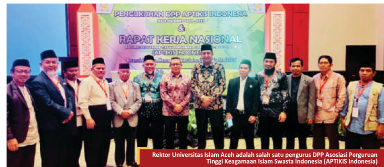
Rektor Universitas Islam Aceh adalah salah satu pengurus DPP Asosiasi Perguruan Tinggi Keagamaan Islam Swasta Indonesia (APTIKIS Indonesia)