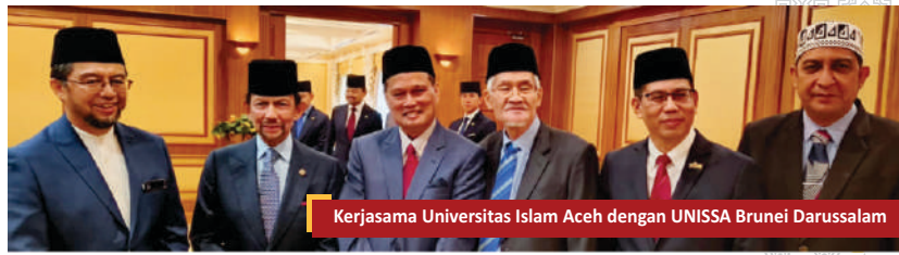
Kerjasama Universitas Islam Aceh dengan UNISSA Brunei Darussalam

"Menjadi Universitas Islam yang Unggul dalam peradaban Nusantara berbasis Peace education, Syariat Islam dan berwawasan Global pada tahun 2045"